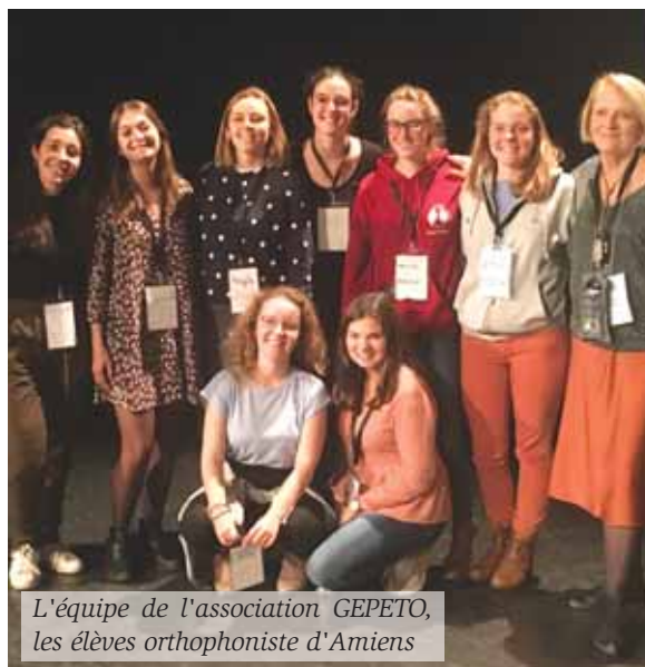
L'équipe de l'association GEPETO, les élèves orthophoniste d'Amiens