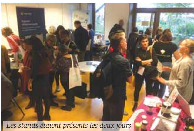
Les stands étaient présents les deux jours