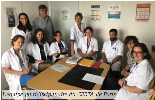
L'équipe pluridisciplinaire du CERTA de Paris

La déficience auditive acquise est un trouble d'une ampleur et d'un impact notable : en France, 6 % de la population présenterait une déficience auditive, soit 7 millions de personnes.