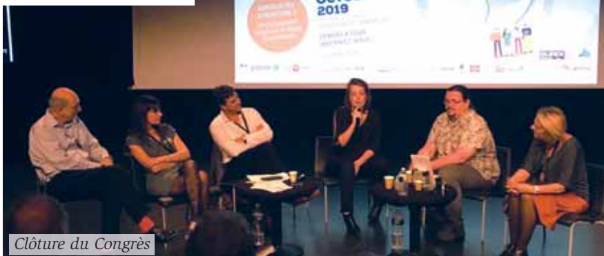
Clôture du Congrès

*GEPETO l'association des élèves orthophonistes d'Amiens : https://assogepeto.wordpress.com/