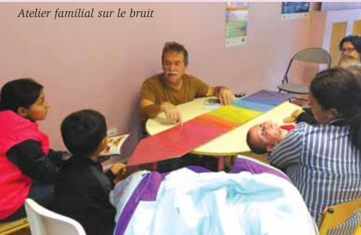
Atelier familial sur le bruit

Outre une mise en situation avec casque et bouchons pour initier les échanges, des ateliers peuvent être proposés en petits groupes de six à huit.