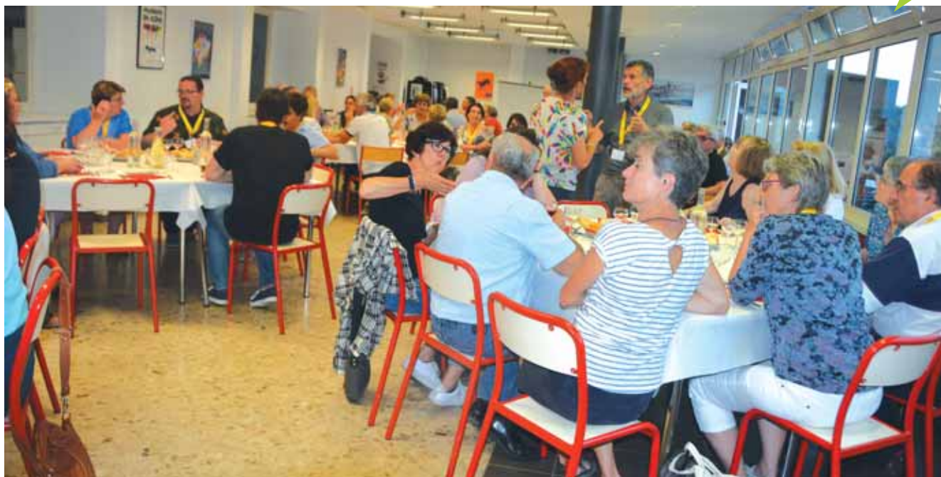
Repas d'anniversaire pour célébrer les 30 ans de Surdi 84 !