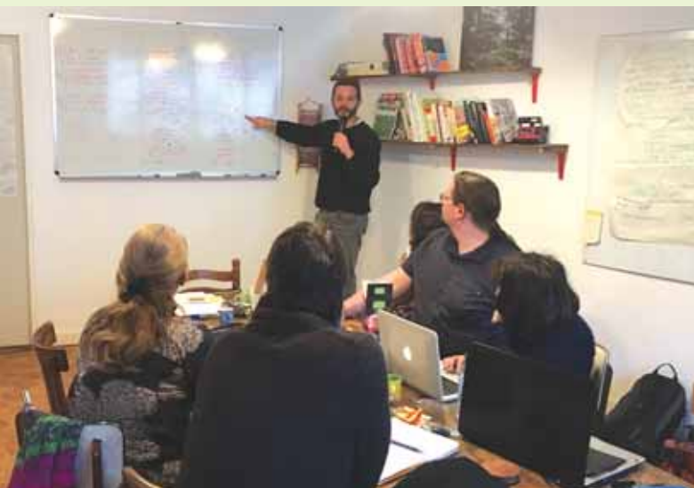
Le groupe de travail « sensibiliser nos députés » s'est réuni en décembre dernier à Rennes

Toute l'équipe du Bucodes SurdiFrance se tient à votre disposition pour vous aider dans vos démarches : contact@surdifrance.org