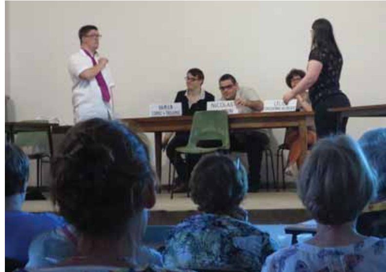
La troupe Insolite Fabriq se produisait à Avignon le samedi 2 juin