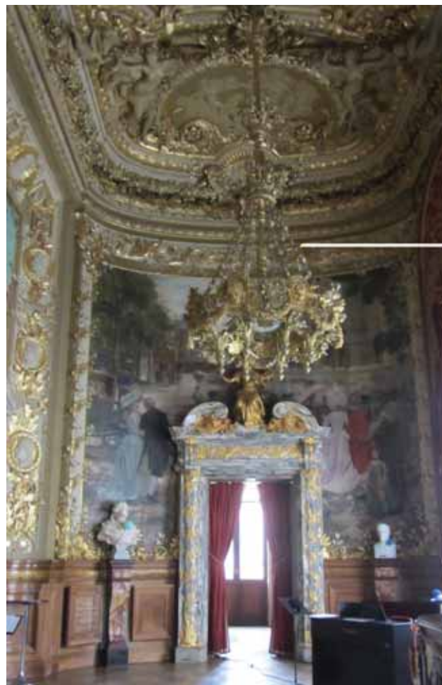
Le Grand Foyer de l'Opéra Comique - fin XIX e

La partie « communication » est importante ; on ne peut s'adapter aux desiderata de chaque adhérent ; chaque association a son propre système de communication : la lettre d'information, un message, un agenda, l'affichage dans un local, mais plus l'association s'agrandit plus le