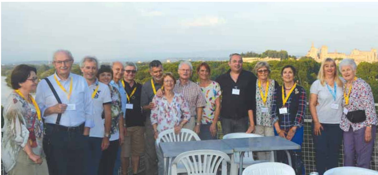
L'association Surdi 84 accueillait l'AG 2018 du Bucodes SurdiFrance.

Conseils pratiques mais aussi philosophiques comme son exposé l'a montré : « Tous ces perçus se conjuguent dans nos pensées, nos rêves, nos sentiments. Tout ce qui nous affecte est essentiel. Ce qui est invisible nous permet d'évoquer, de créer, de nous souvenir, d'anticiper, de méditer, d'admirer, et d'aimer. Ce que nous pouvons percevoir de bienveillance est attention, et intention de partager. Ce que nous découvrons par volonté, curiosité, désir de vie, besoin de vie sociale... la perception est quelque chose de très subjectif. Mais si un seul sens nous manque, tout est transformé. Les autres sens seront plus actifs. Quelle présence de l'invisible! »