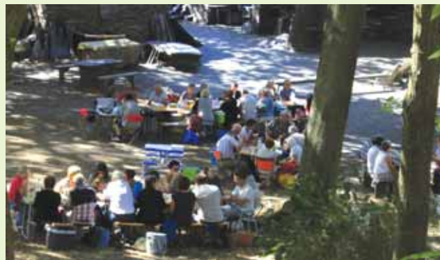
Pique-nique sur les buttes de schistes ardoisiers et sous les grands chênes

(découpe pour obtenir des « repartons » ou blocs de taille supérieure à la plus grande ardoise), fendage à l'ancienne (séparation des feuillets de la roche), rondissage ou taille selon 17 modèles différents ! Il fallait aussi lui apprendre à « lire la pierre » pour qu'il veille à placer le longrain (la direction selon laquelle la roche a été plissée) dans le sens de la longueur de la future ardoise. Le premier jour de l'apprentissage, une petite fête était organisée. Le jeune garçon arrivait devant la cabane de son maître, qui avait invité ses amis maîtres-ardoisiers. Tous faisaient cercle autour de l'enfant ; il tendait une jambe, le maître la couvrait d'une guêtre jusqu'au genou, le jeune mettait lui-même la seconde guêtre et toutes deux étaient arrosées de vin rouge ! On donnait un surnom à l'apprenti, son « nom de seigneurie ». Par exemple, à cause de sa passion pour les oiseaux, notre guide a été surnommé « Rossignol ».