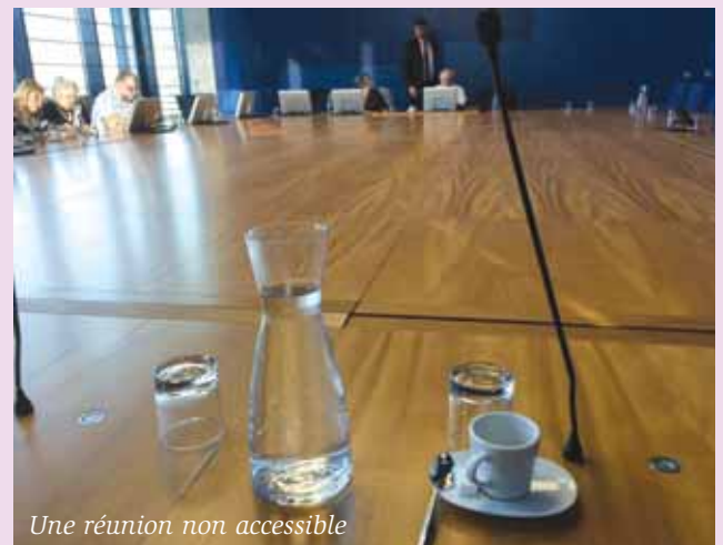
Une réunion non accessible

Les accueils des ERP de service public (3) et des ERP de 1 er et 2 e catégorie doivent être équipés d'une BIM.