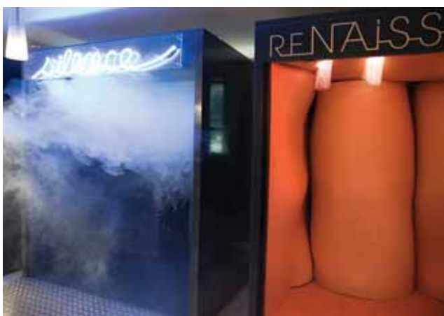
Un parcours sensoriel d'exposition composé de plusieurs modules

Deux à trois semaines avant la formation, un temps de sensibilisation est proposé sur la thématique des handicaps sensoriels. « Le parcours sensoriel est une exposition artistique qui plonge les visiteurs dans un univers sensoriel unique, propice aux échanges et à la découverte de nos potentiels », explique Deza Nguembock, directrice générale d'E&H LAB. Cette étape se tient sur plusieurs jours avec un parcours sensoriel associé à un programme d'animations qui varie selon les villes. Les associations du Bucodes SurdiFrance situées à proximité de cet événement pourront proposer une animation ou une action de sensibilisation de leur choix, en concertation avec l'organisation.