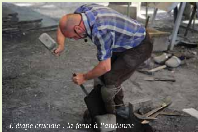
L'étape cruciale : la fente à l'ancienne

Fendeur n'était pas un métier que l'on apprenait dans une école : un maître-ardoisier formait son apprenti, âgé de 12-13 ans, pendant cinq années, le temps de l'initier à tous les aspects du métier : débitage, quernage