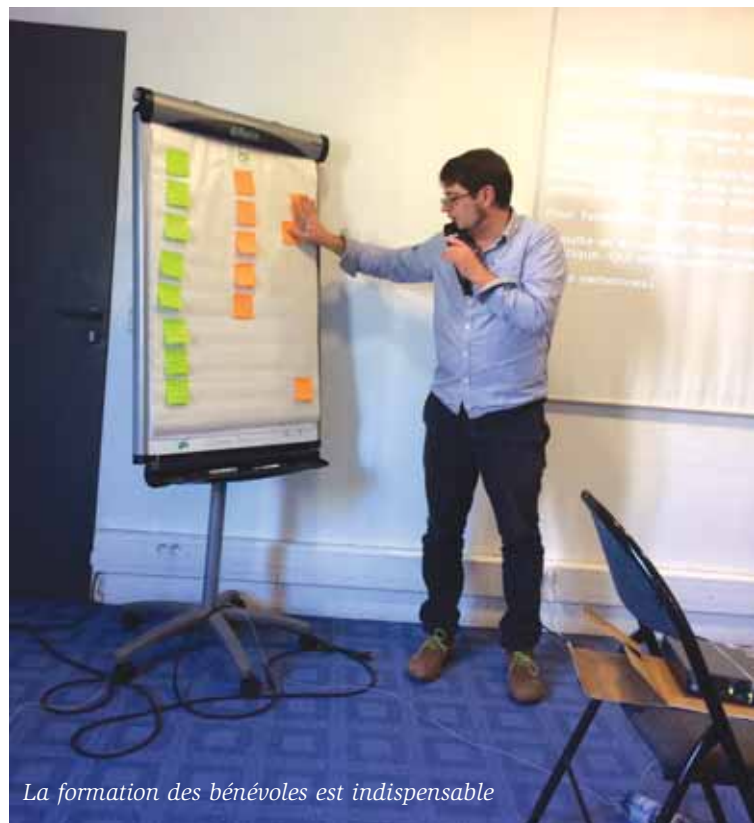
La formation des bénévoles est indispensable

Un accompagnement démarre toujours par un entretien individuel assez long, dans un lieu calme. Ce temps d'écoute empathique va permettre au malentendant d'exprimer ses difficultés, sa souffrance, de verbaliser ses attentes et ses besoins. Le bénévole peut alors donner quelques pistes que l'adhérent pourra explorer. Si besoin, on fixera un deuxième rendez-vous. Lors de cette deuxième rencontre, le malentendant apportera des éléments de recherche qui vont permettre l'avancée du dossier. Pour l'achat d'un appareil auditif on pourra lui donner le conseil de demander plusieurs devis, de consulter le site de la CPAM : www.ameli.fr , de se renseigner auprès de sa mutuelle du taux de remboursement, de télécharger un dossier MDPH, de se renseigner auprès de la médecine du travail, etc.