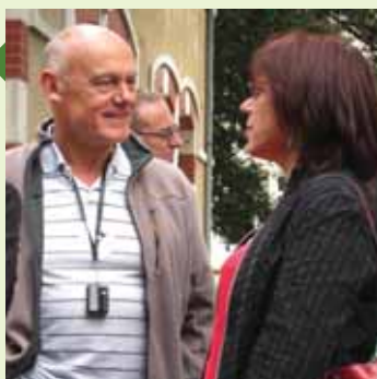
Papotage à la récré