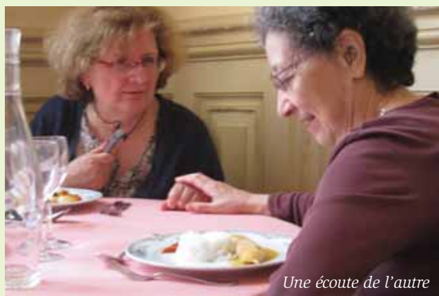
Une écoute de l'autre

Dès l'arrivée, on remarque qu'il se passe quelque chose. Il y a une envie folle de parler, un besoin de s'exprimer, de se dire, de communiquer, de créer du lien réel tellement différent du simple « contact » virtuel proposé par mail ou Internet. Ainsi s'installe une convivialité toute naturelle. Le badge qui est remis porte en grosses lettres le prénom. Cette distinction, pour banale qu'elle soit, permet de sortir de l'anonymat, d'être connu et reconnu. Alors que la personne peut parfois être maltraitée, reconnaissons qu'il est agréable d'être appelé par son prénom. Ainsi chacun devient plus disponible pour écouter l'autre, s'intégrer et se sentir accepté dans le groupe.