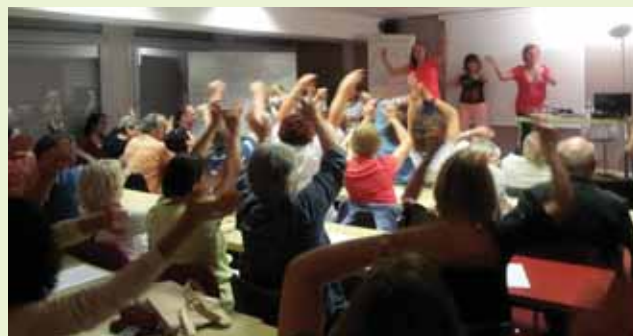
Placement de la voix et rythme