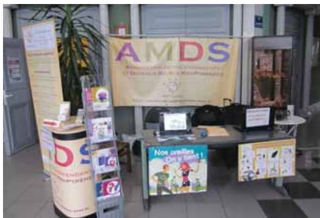
Intervention de l'AMDS dans les Mairies et écoles

Nous intervenons auprès des jeunes publics à la demande des écoles, collèges ou lycées pour sensibiliser les enfants et adolescents aux dangers du bruit et à leur prévention. Nous intervenons dans des actions de formation auprès des personnels d'entreprises afin de faciliter l'intégration des salariés en situation de handicap.